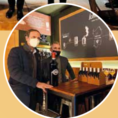
A destra, il Governatore Fedriga assieme a Delle Crode in un angolo del locale Muniti di mascherina mentre conversavano tra loro