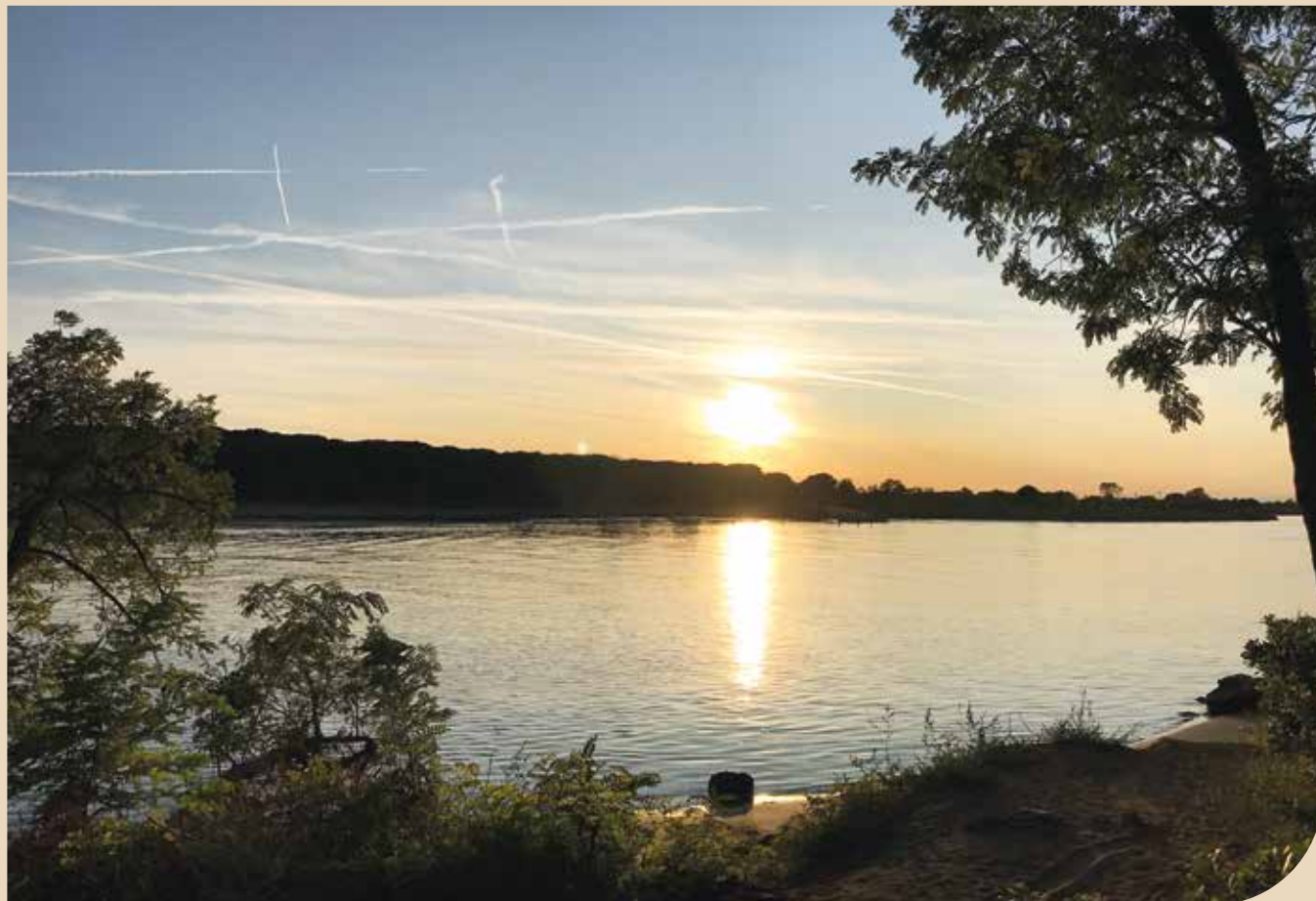
Tramonto sul Tagliamento

La Pasqua è risveglio, lo sia delle coscienze oltre che della natura, lo sia in termini di solidarietà immediata, pratica, perché ci sono bisogni primari, ma anche solidarietà morale. Un abbraccio, una stretta di mano, un saluto, certamente non risolvono la gravità del problema, ma sono un segnale che dobbiamo, laica o cristiana che sia, la nostra lettura della vita di ogni giorno.