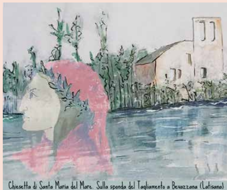
Chiesetta di Santa Maria del Mare. Sulla sponda del Tagliamento a Bevazzana (Latisana)

Un fraticello alzò la mano benedicente, toccando poi la corda che dava voce alle campane: un suono melodioso spargendosi nell'aria accompagnò la barca che scivolando veloce sul nastro azzurro del Tagliamento spariva nel verde delle chiome degli alberi inclinati sul fiume. Dante fece a tempo a ricambiare quel saluto e si predispose alla fermata di Portus Tisane, dove lo attendeva la scorta inviata dai Signori di Gorizia.